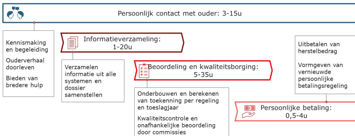
Figuur 3: Indicatie behandelijd per ouder voor herstelactiviteiten

Mijn belangrijkste conclusie uit figuur 3 is dat – na toepassing van de gekozen versnellingsoptie, optie 4 – verdere versnelling in het proces niet mogelijk is zonder afbreuk te doen aan de centrale uitgangspunten van de hersteloperatie. De voornaamste tijdsbesteding in het herstelproces zit namelijk in het individuele contact en maatwerk richting ouders inclusief het indien nodig helpen van ouders met aanvullende hulpvragen bij derden (~15-20%), in het verzamelen van informatie om de situatie van de ouders in kaart te brengen en het verhaal van de ouder te bevestigen (~30%), in het waarborgen van de consistentie en zorgvuldigheid van de beoordeling, zeker bij zaken waarin de ouder op basis van de regelingen geen (volledig) herstel kan krijgen (~40%), en in het vormgeven van een persoonlijke betaling rekening houdend met de situatie van de ouder (~10-15%). Het versnellen van deze activiteiten doet dus ofwel afbreuk aan de maatwerk hulp die we de ouder bieden ofwel aan de zorgvuldige, individuele beoordeling van de situatie van de ouder. Dit loslaten zou niet in lijn zijn met de afspraken die ik eerder met uw Kamer heb gemaakt en met de regelingen die ten behoeve van de hersteloperatie zijn ontworpen.